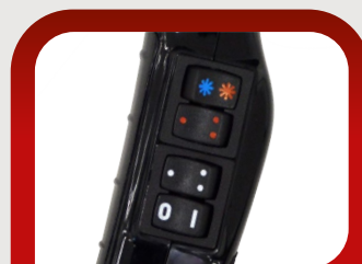
Interruttori temperatura e velocità + colpo aria fredda