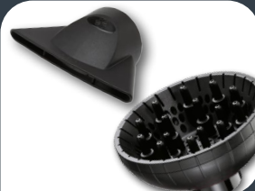
Optional Bocchetta OAS PLUS 90mm + diffusore